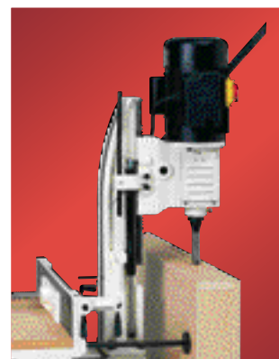
Travail en position basculée à 180°