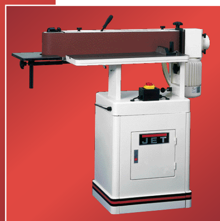
EHVS-80 sans oscillation