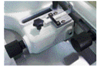
Guide de toupie micro-réglable