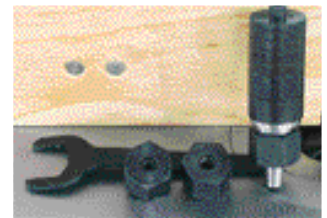
Accessoire: Broche de fraisage 30 mm (No d'article 10000251)